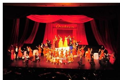
令和元年度 「チャルダッシュの女王」