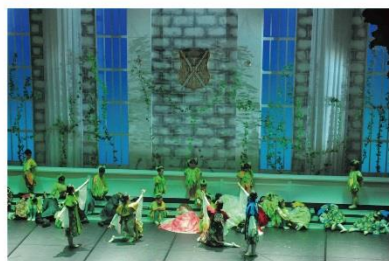
平成30年度 「眠れる森の美女」