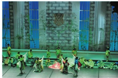
平成30年度 「眠れる森の美女」