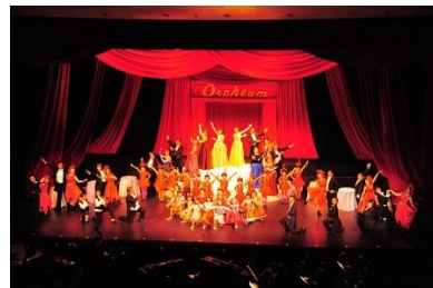
令和元年度 「チャルダッシュの女王」