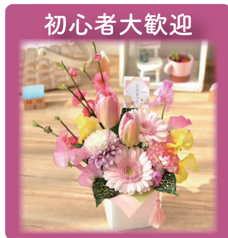
※イメージ写真。実際の花材は異なります。